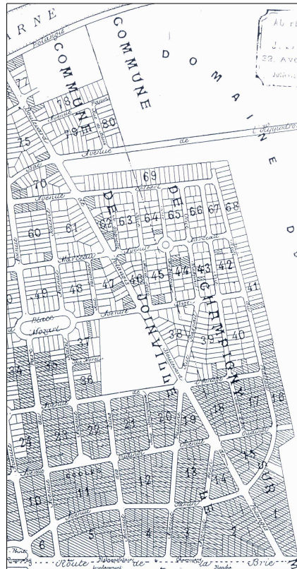
Lotissement du domaine de Polangis, situé sur les communes de Joinville et de Champigny

Les plans figuratifs ci-dessous illustrent bien le caractère traditionnel de l'organisation régulière des parcelles et de leur implantation par rapport aux voies.